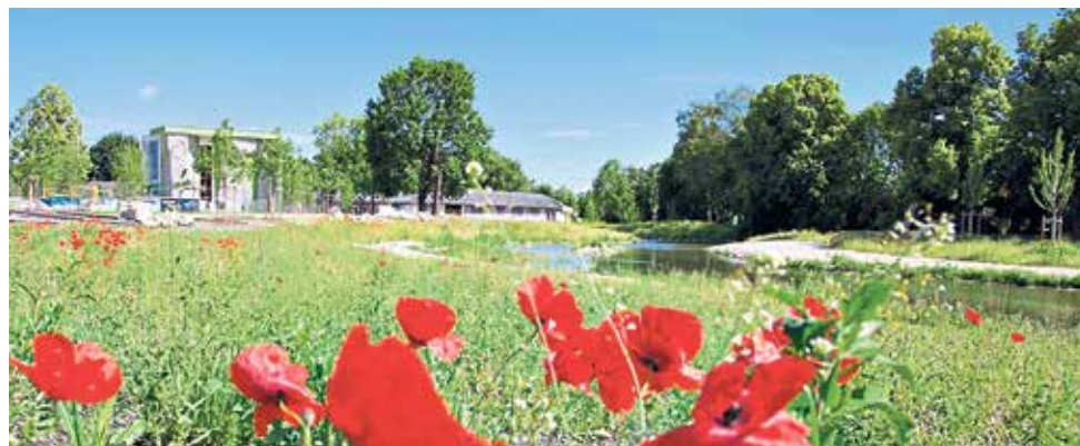
Rathaus von Pfaffenhofen und Gelände der Gartenschau | Areál, kde probíhá zahradnická přehlídka