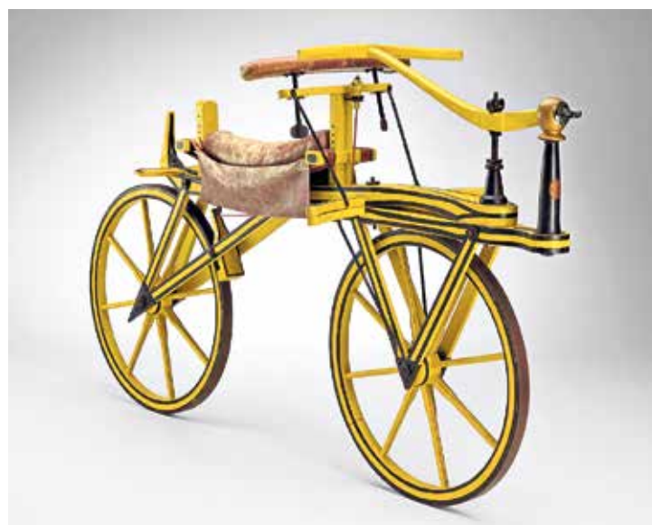
Laufmaschine nach Karl von Drais, um 1820 (Nachbau) (Abb.: TECHNOSEUM, Klaus Luginsland; „2 Räder – 200 Jahre“, Ausstellung des TECHNOSEUM in Mannheim) | Kolo bez pedálů podle Karla von Draise, kolem roku 1820 (kopie) (Foto: Technoseum, Klaus Luginsland; „2 kola - 200 let“, výstava v muzeu TECHNOSEUM v Mannheimu)

Wer sich für die Geschichte des Fahrrads interessiert, findet in der Europaregion einige Fahrradmuseen: In Arnschwang bei Cham ist ein