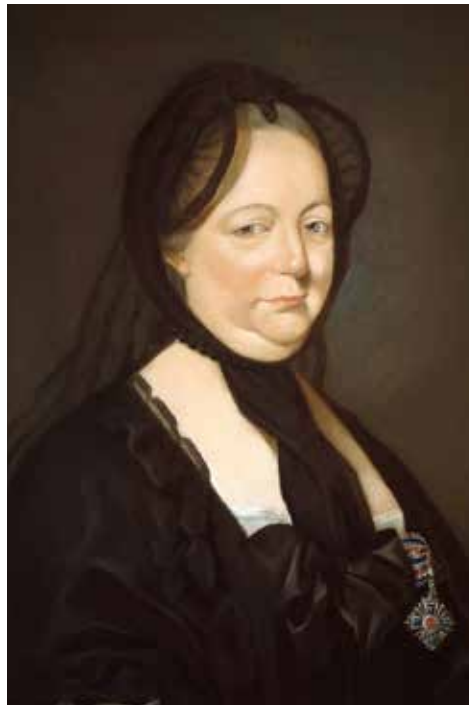
Maria Theresia als Witwe. Joseph Ducreux, nach 1769 / Vdova Marie Terezie. Joseph Ducreux, po roce 1769.

K výročí 300 let od narození Marie Terezie jsou uspořádány velké výstavy ve Vídni, na zámku Hof a na zámku Niederweiden v Dolním Rakousku. Marie Terezie zde bude zobrazena jako vládkyně, reformátorka a strateg, jako matka země a jako žena ve všech jejích podobách. Výstavy trvají až do 29. listopadu 2017. Více informací najdete na www.mariatheresia2017.at .