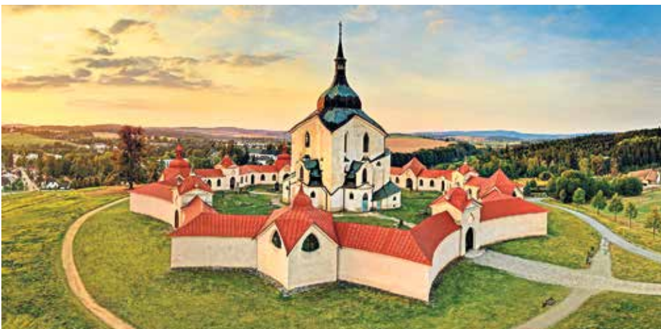
Wallfahrtskirche des Hl. Nepomuk in Žďár nad Sázavou (Saar) | Poutní kostel sv. Jana Nepomuckého ve Žďáru nad Sázavou