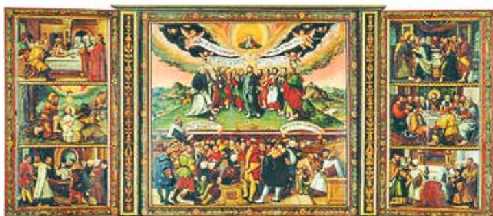
Michael Ostendorfer, Reformationsaltar, Regensburg 1554/55, Historisches Museum Regensburg

Ostendorfers Leben fällt in die bewegte Zeit der Reformation. Seine ersten Jahrzehnte liegen allerdings im Dunkel der Geschichte. Vermutlich um das Jahr 1494 geboren, begann er als Jugendlicher seine Lehre in der Regensburger Werkstatt Albrecht Altdorfers. 1519 wird er zum ersten Mal als Meister zu Regensburg erwähnt und tritt mit Arbeiten im Umfeld der Wallfahrt „Zur Schönen Maria“ ins Licht der Öffentlichkeit.