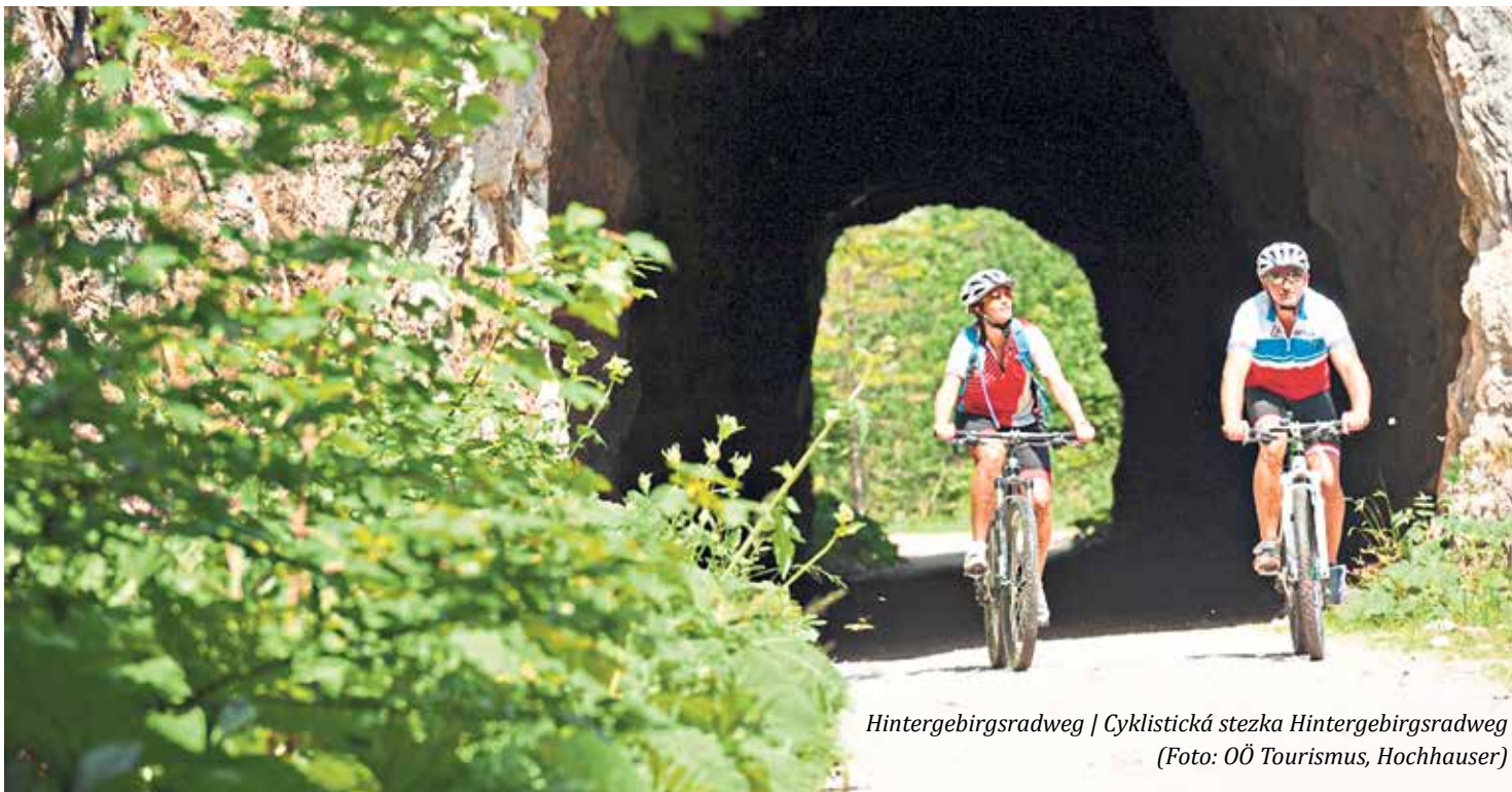
Hintergebirgsradweg | Cyklistická stezka Hintergebirgsradweg