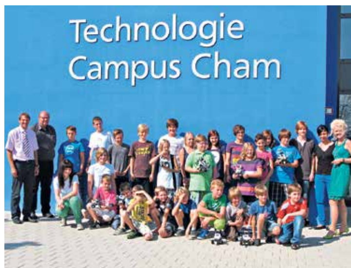
„Technik für Kinder“ lernen die Kleinsten am Technologie Campus Cham kennen. | Nejmłodší návštěvníci se seznamují v rámci Technologického kampusu v Chamu s „Technikou pro děti“