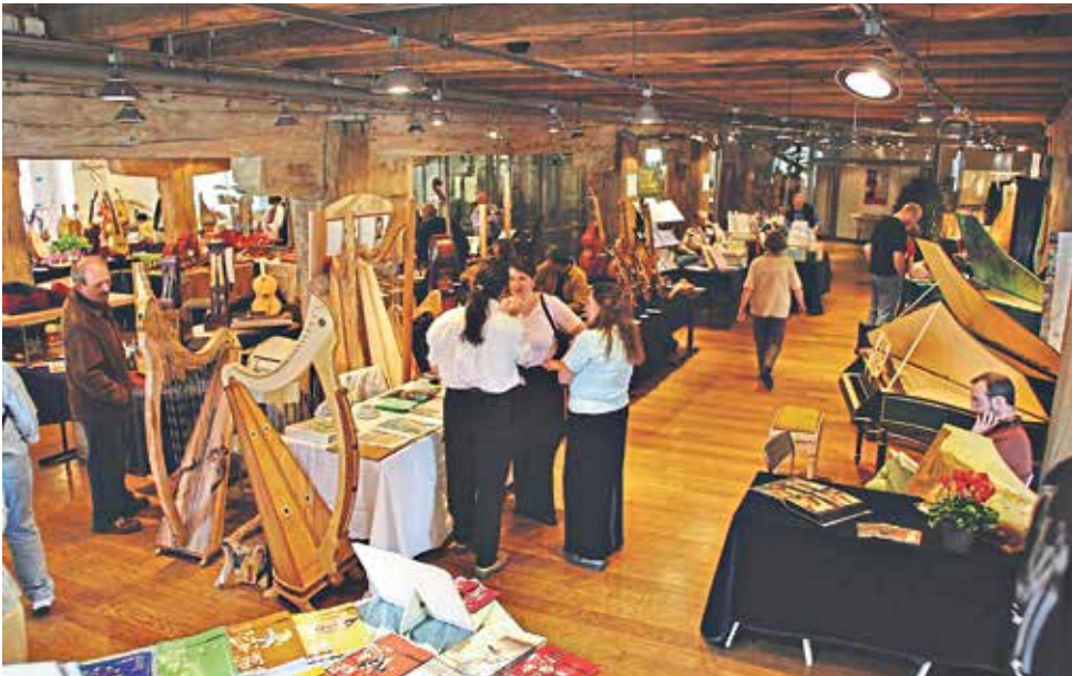
Ausstellung im Salzstadel | Výstava v historické budově Salzstadel