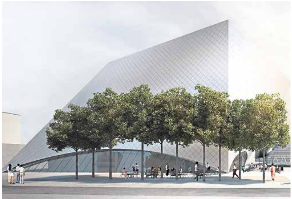
Entwurf der Landesgalerie Niederösterreich | Návrh Zemské galerie Dolního Rakouska (Abbildung marte.marte)

Die Website zur Stadtentwicklung www.krems2030.at