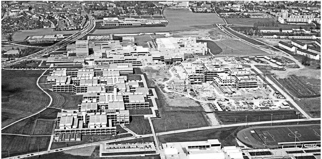
Blick auf die Universität im Jahr 1974 | Pohled na univerzitu v roce 1974