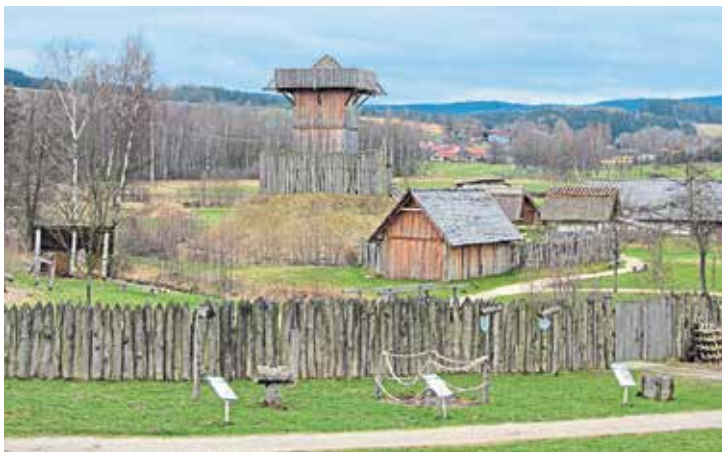
Blick auf die Turmhügelburg und Dorfgebäude | Pohled na hrádek typu motte a vesnická stavení

Wichtig ist den Machern des Geschichtsparks das authentische Abbild des mittelalterlichen Lebens: Was haben die Leute gegessen, wie haben sie sich gekleidet, wie waren die Erträge der Landwirtschaft,