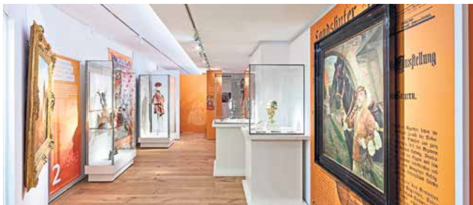
Einblick in das Modul »Landshuter Hochzeit« | Pohled do expozice „Svatba v Landshutu“