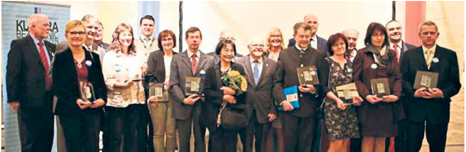
Brückenbauer 2017: Die Preisträger und Laudatoren | Stavitelé mostů 2017: nositelé ocenění