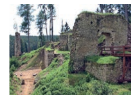
Burgruine / Zřícenina Pořešín