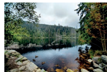
Gletschensee Prášily / Prášilské jezero

Vyjíždíme z horského města Železná Ruda , jehož dominantu představuje barokní kostel, dále můžeme navštívit Muzeum Šumavy či Muzeum historických motocyklů. Cyklotrasa 2113 nás krásnou přírodou přivede k bývalé obci Hůrka. Cestou můžeme zajet k blízkému ledovcovému jezeru Laka . Dojedeme do obce Prášily , kde si můžeme prohlédnout nejvýše položenou venkovní botanickou zahradu v ČR. Stále po stejné cyklotrasě vystoupáme k rozhledně Poledník . Na rozcestí Javoří pila se dáme po 2117 k rozcestí Pod Oblíkem a poté po 2122 k rozcestí Pod Hakešickým mostem, kde se napojíme na Otavskou cyklotrasu, po níž projíždíme kolem významné technické památky – Vchynicko-Tetovského plavebního kanálu . Dojedeme až k rozcestí Velký Bor, odtud pokračujeme po cyklotrasě 33 do obce Prášily, kde můžeme navštívit Archeopark. U rozcestí Prášilský potok se dáme po 2119 a na křižovatce cyklotras budeme následovat 2115 až do Nové Hůrky, odkud nás čeká již jen zpáteční cesta po 33 do Železných Rud.