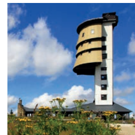
Aussichtsturm / Rozhledna Poledník

Unterwegs lohnt sich ein Abstecher zum nahen Gletschensee Laka . Wir gelangen in die Ortschaft Prášily , wo wir den höchstgelegenen botanischen Freilandgarten in Tschechien besichtigen können. Immer noch auf dem gleichen Radweg steigen wir zum Aussichtsturm Poledník . An der Wegkreuzung Javoří pila wechseln wir auf den Radweg 2117 und fahren bis zum Wegweiser Pod Oblíkem und dann auf den 2122 zum Wegweiser Pod Hakešickým mostem, wo wir uns dem Radweg Otavská anschließen. Auf diesem fahren wir an einem bedeutenden technischen Denkmal entlang – dem Vchynice-Tetov-Schwemmkanal . Wir radeln bis zum Wegweiser Velký Bor, von wo wir auf dem Radweg 33 zur Ortschaft Prášily gelangen. Hier können wir einen Archäopark besuchen. Am Wegweiser Prášilský potok nehmen wir den Radweg 2119 und an der Radwegkreuzung folgen wir dem 2115 bis nach Nová Hůrka. Dort geht es auf dem Radweg 33 schließlich zurück nach Železná Ruda.