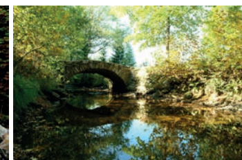
Vchynice-Tetov-Schwemmkanal Vchynicko-Tetovský plavební kanál