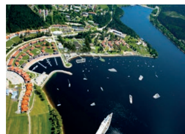
Lipno nad Vltavou - Marina

Olympijský okruh startuje v Loučovicích na cyklotrase 33, vede okolo Čertovy stěny do Vyššího Brodu , kde na náměstí odbočíme po 1033 směrem na Mnichovice, přes Kapličky, Spáleníště, Pasečnou až směrem na Vítkův Hrádek . Pokračujeme přes Rakovskou zátoku a zaniklé osady Kyselov a Horní Pestrice až do Zadní Zvonkové , kde se trasa také přibližuje k unikátní šumavské technické památce - Schwarzenberskému plavebnímu kanálu , podél kterého dojedeme až na rozcestí na Klápě. Stále po 1033 odbočíme doprava na Novou Pec, kde na křižovatce zahame doprava a pokračujeme po páteřní cyklotrase 33 směrem k osadě Bělá. Nová cyklostezka nás povede podél jezera přes rekreační osadu Hory a Pernek do Horní Plané. Kolem místní ČOV přes chatovou osadu Jenišov dorazíme k hlavní silnici. Po jejím překonání již jedeme dále po samostatné cyklostezce až do osady Hůrka a Černá v Pošumaví. Krátce po hlavní silnici přechází trasa na severním okraji na místní komunikaci směrem na Muckov, kde odbočíme doprava a (stále po cyklotrase 33) sjedeme k Pláničskému rybníku až přijedeme k osadě Milná . Přes chatové osady Kovářov, Hrdoňov a Posudov se dostaneme do Frymburka. Zde se - po krátkém přejezdu po hlavní komunikaci - opět vrátíme na jezerní cyklostezku podél Lipna zpět do Loučovic.