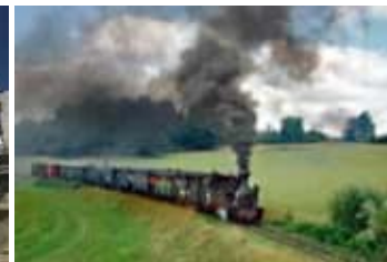
Schmalspurbahn in Jindřichův Hradec Jindřichohradecká úzkokolejka