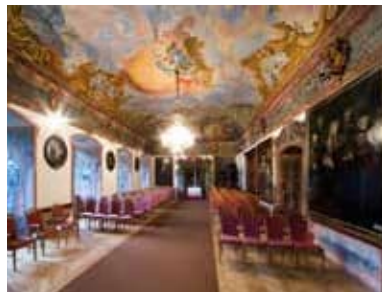
Manětín - Barockschloss / barokní zámek

Viklan či Dědek. Ze Žihle se vydáme po cyklotrase 2261 přes Odlezy do Mladotic. Poblíž obce Odlezy se nachází unikátní Odlezenské jezero. Za Mladotice zatočíme doprava na částečně nepevněnou cyklotrasu 2260, kterou se následně napojíme na cyklotrasu 352, která nás přes Ondřejov dovede zpět do Pláně, kde zatočíme doleva a přes Vrážně se vrátíme do Plas.