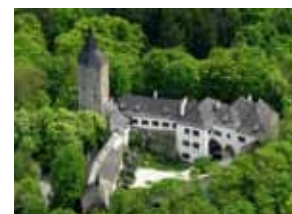
Burg / Hrad Roštejn